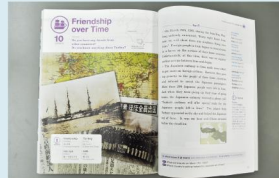
平成25年から高校の英語の教科書にも取り上げられている物語(啓林館)