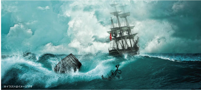
※イラストはイメージです