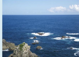
エルトゥールル号が座礁した岩礁「船甲羅」