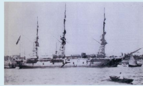
トルコ軍艦 エルトゥールル号