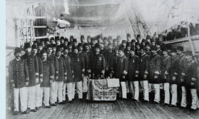
エルトゥールル号 士官集合写真