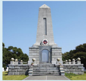
エルトゥールル号 殉難将士慰霊碑