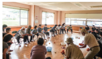
都路町元気な地域づくりの会