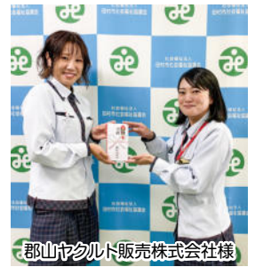
郡山ヤクルト販売株式会社様