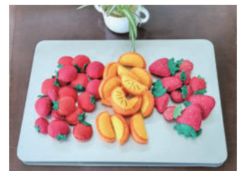
フェルトで作った果物