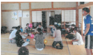
ニコニコ上町元気サロン