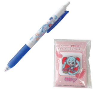
初音ミクボールペン(200円) 初音ミクピンバッジ(500円)