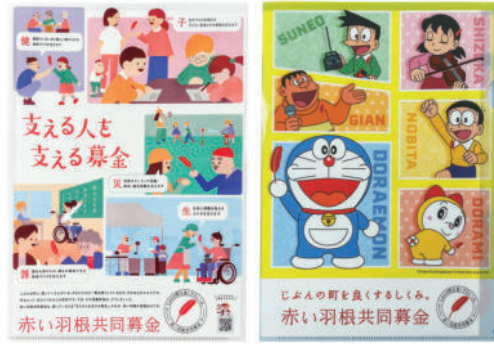
クリアファイル(200円) ドラえもんクリアファイル(200円)