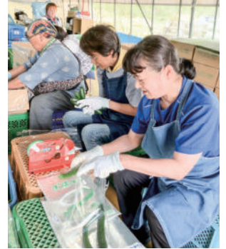
三春町の農園では、きゅうりの仕分けや袋詰め作業を行いました。

これからも、地域にあるさまざまな社会資源とつながり、必要な技術等を身につける体験の機会を設け、就労定着の支援を行ってまいります。