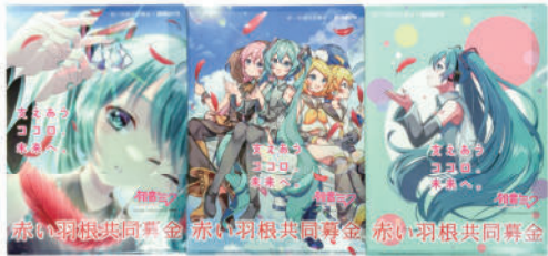
初音ミククリアファイル(各200円)