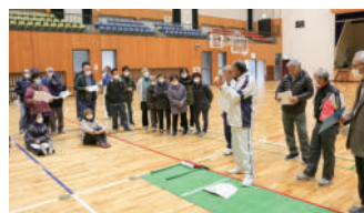
大越町老人クラブ連合会

本会では、市民の皆様の福祉活動を応援する補助・助成事業がありますので、お気軽にお問い合わせください。